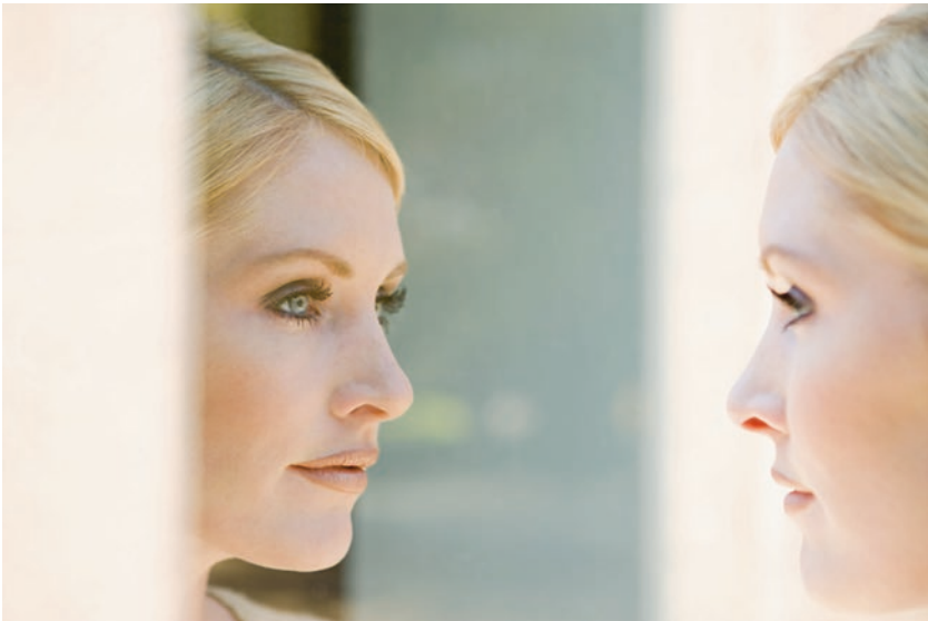
Abb. 10.1 Spiegelbild.

Selbstannahme, Wertschätzung für die eigene Person, Selbstverantwortung und Akzeptanz sich selbst und anderen gegenüber sind Grundvoraussetzungen, um gesund zu bleiben. Je genauer Sie Ihre Stärken und Schwächen kennen, je realistischer Sie in Ihrer Selbsteinschätzung sind, desto besser gelingt Ihnen Ihr Selbstmanagement. Umso schneller erkennen Sie, wo Sie sich selbst sabotieren, und können entsprechend gegensteuern. Das verleiht Ihnen Souveränität, Gelassenheit, Stabilität und Glaubwürdigkeit (Abb. 10.1).